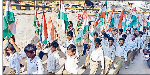
रेवाड़ी। तिरंगा रैली निकालते राजकीय वरिष्ठ माध्यमिक विद्यालय बावल के विद्यार्थी तथा तिरंगा साइकिल यात्रा निकालते शिक्षक व विद्यार्थी।

रक्षा बंधन के पावन पर्व में भी हर घर तिरंगा राखी बनाने की कार्यशाला के आयोजन के साथ ही सैनिकों और पुलिसकर्मियों को आभार पत्र लिखकर डाक विभाग के समन्वय से राखियां भेजी जाएंगी। जिला शिक्षा अधिकारी