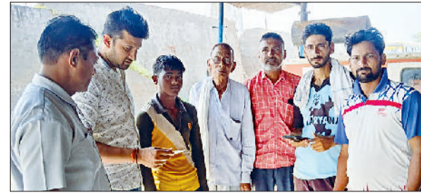
रेवाड़ी। श्रमिकों के पहचान पत्र चेक करती पुलिस।

अच्छी बरसात हुए बिना उमस और गर्मी से राहत की उम्मीद नहीं है। मौसम विभाग का अनुमान है कि अगले एक सप्ताह तक आसमान में बादल तो छाएंगे, परंतु अच्छी बारिश की संभावना नहीं है। तेज हवाओं के साथ हल्की बरसात या बूंदबांदी जरूर हो सकती है। इस दौरान तापमान में भी उतार-चढ़ाव बना रहेगा।