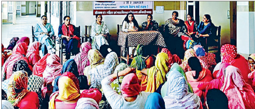
रेवाड़ी। महिलाओं को जानकारी देते हुए सुपरवाइजर।