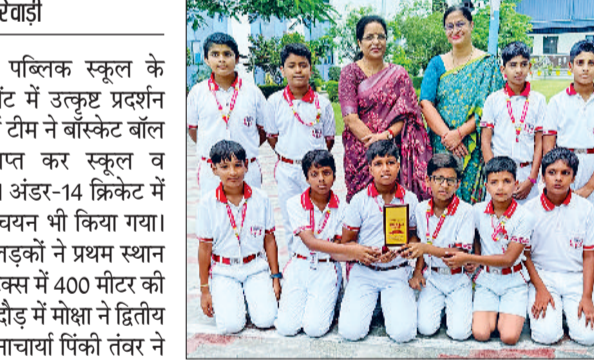
रेवाड़ी। विजेता टीम प्रधानाचार्या के साथ।