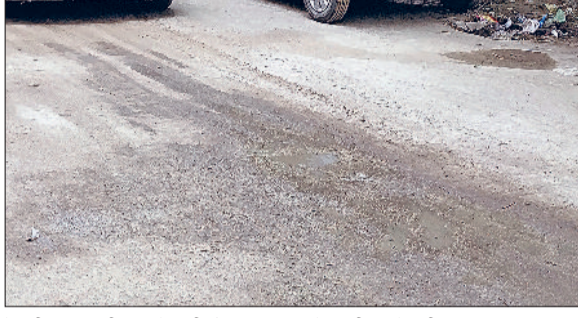
गई सड़कों की हालत 5 महीने में ही दयनीय होती जा रही है। ब्रास मार्केट में 2.62 करोड़ की लागत से अक्टूबर 2024 में सड़कों का नव निर्माण किया जा रहा है, लेकिन मार्च माह से बनाई गई सड़कों की रोड़ियां निकल कर गड़्डे भी होने शुरू हो गए हैं।