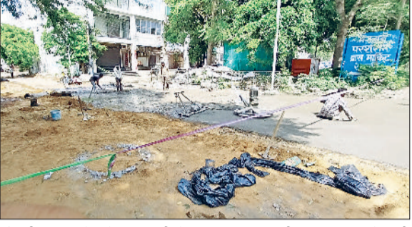
रेवाड़ी। ब्रास मार्केट में अनाजमंडी से ब्रह्मगढ़ तक बन रही सड़क, ब्रास मार्केट की पहले बनी सड़क की दिखने लगी रोड़ियां, ब्रास मार्केट की पहले बनी सड़क पर हुआ गड़्डा।

नगर परिषद की नई सड़कें गुणवत्ता की कमी के कारण बनते ही बिखरने लगी हैं। दस दिन पहले विजिलेंस की टीम की ओर से मॉडल टाउन, सेक्टर-3 व वार्ड नंबर-2 की नई सड़कों के संपल भी लिए गए थे। ब्रास मार्केट में नई सड़क बनाने का रूका हुआ कार्य फिर से शुरू हो गया है। मार्केट में अब नई अनाजमंडी मार्ग से ब्रह्मगढ़ परिसर तक की सड़क का नव निर्माण किया जा रहा है, लेकिन ब्रास मार्केट की मार्च माह से बनाई गई सड़कों की रोड़ियां निकल कर गड़्डे भी होने शुरू हो गए हैं। सड़क निर्माण कार्य पूरा होने से पहले ही भ्रष्टाचार नजर आने लगा है। कार्य काफी धीमी गति से चलने के कारण लोगों को गड़्डों के कारण परेशानी उठानी पड़ रही थी। ब्रास मार्केट की मार्च से अप्रैल तक बनाई