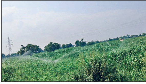
रेवाड़ी। एक खेत में लहलहाती फसल।

सावन माह की विदाई का समय आने के साथ ही मानसून भी दम तोड़ने लगा है। दो दिन से हल्की बरसात का सिलसिला भी बंद हो गया है, जिससे भारी गर्मी ने लोगों को परेशान करना शुरू कर दिया है। हवा में नमी बरकरार रहने के कारण चिपचिपी गर्मी लोगों के