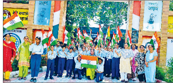
रेवाड़ी। तिरंगा रैली निकालते राजकीय वरिष्ठ माध्यमिक विद्यालय पाल्हावास के विद्यार्थी।