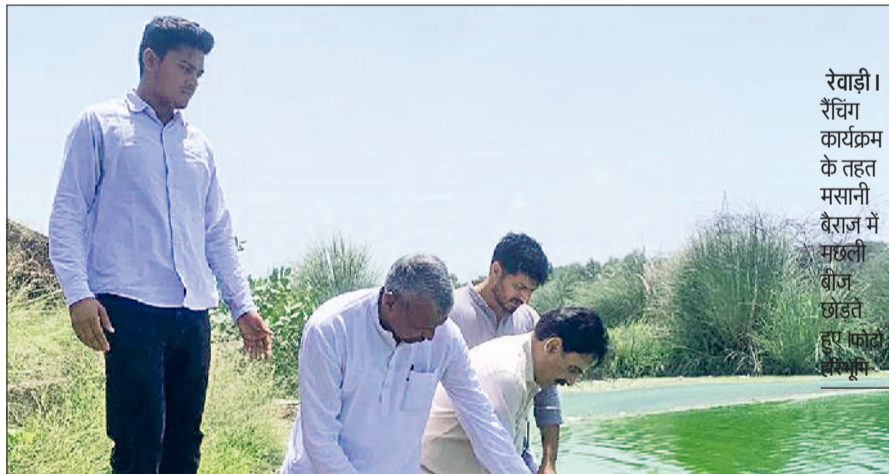
रेवाड़ी। रैंचिंग कार्यक्रम के तहत मसानी बैराज में मछली बीज छोड़े गए।

एसडीएम ने कहा कि मछली पालन आमदनी का महत्वपूर्ण साधन है। इसके साथ-साथ यह जलाशयों के सद्बुयोग का अच्छा माध्यम है। सरकार की सोच है कि मत्स्य पालन के साथ-साथ मछली संरक्षण को बढ़ावा दिया जाए, जिसके लिए सरकार की ओर से रैंचिंग कार्यक्रम की शुरुआत की गई