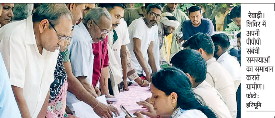
रेवाड़ी। शिविर में अपनी पीपीपी संबंधी समस्याओं का समाधान कराते ग्रामीण।

फैमिली आईडी के माध्यम से सरकार द्वारा चलाई जा रही 519 योजनाएं अब सीधे पात्र परिवारों से जुड़ चुकी हैं। हरियाणा की नायब