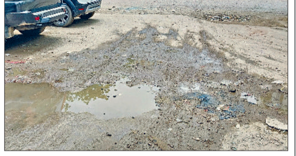
रेवाड़ी। अनाजमंडी रोड पर पैवमेंट की निकली रोड़ियां।