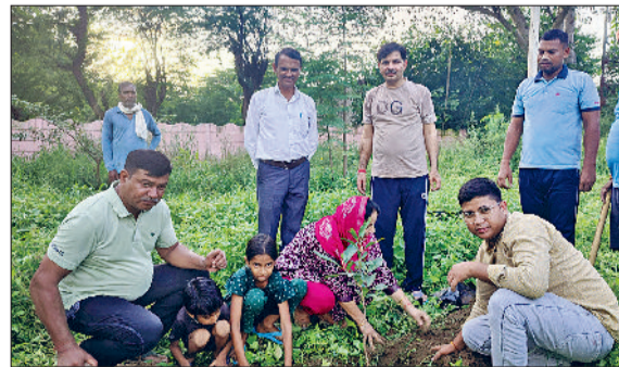
रेवाड़ी। गांव मीरपुर में पौधारोपण करते हुए नागरिक।